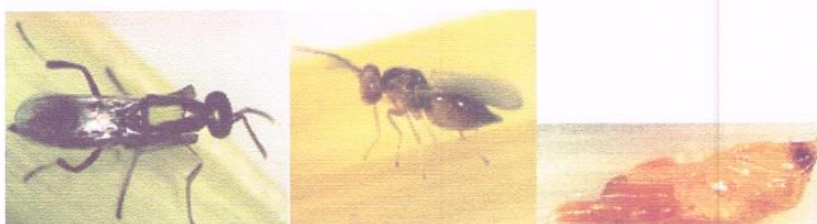
แตนเบียนดักแด้