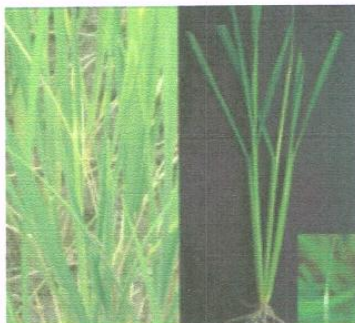
ลักษณะต้นข้าวที่แมลงบั่วทำลาย (หลอดบั่วหรือหลอดหอม)

สภาพแวดล้อมที่เหมาะสมต่อการเพิ่มปริมาณของแมลงบั่ว กล่าวคือ มีความชื้นสูง มีพื้นที่เป็นภูเขาหรือเชิงเขา ล้อมรอบ ทั้งนี้เพราะความชื้นมีความสัมพันธ์กับการวางไข่ จำนวนไข่การฟักไข่ การอยู่รอดหลังจากฟักจากไข่ของ หนอนและการเข้าทำลายยอดอ่อนของต้นข้าว