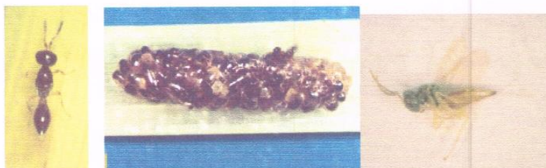
แตนเบียนไข่ – หนอนแมลงบั่ว แตนเบียนหนอนแมลงบั่ว